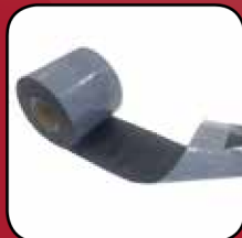
Easy Foil ST