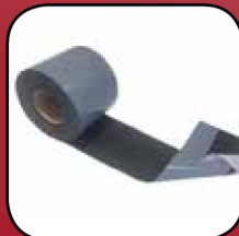
Easy Foil SI