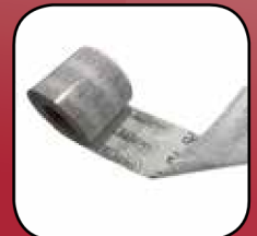
Easy Foil DUO+