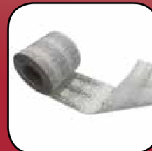
Easy Foil DUO