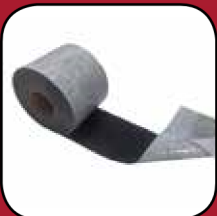
Easy Foil OS Black